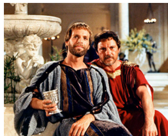
1986 L'ENQUÊTE (L'Inchiesta) de Damiano Damiani avec Harvey Keitel