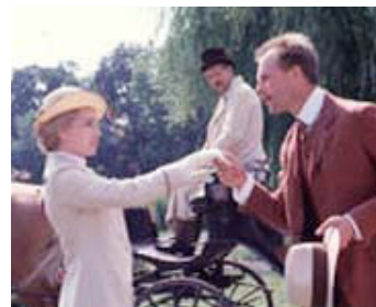
1990 THE BACHELOR (Mio caro dottor Gräsler) de Roberto Faenza avec Miranda Richardson