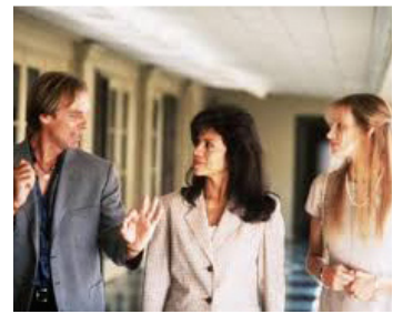
1995 LES LIENS DU SANG (The Tie that blinds) de Wesley Strick avec Daryl Hannah, Moira Kelly