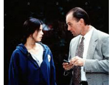
1996 DEUX JOURS À LOS ANGELES (2 Days in the Valley) de John Herzfeld avec Teri Hatcher