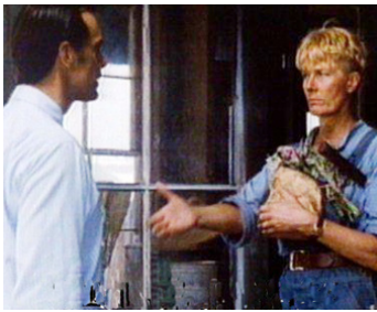
1991 THE BALLAD OF THE SAD CAFÉ de Simon Callow avec Vanessa Redgrave