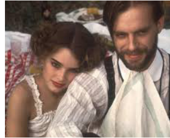
1978 LA PETITE (Pretty Baby) de Louis Malle avec Brooke Shields