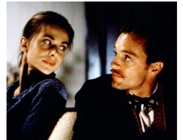
1984 MARIA'S LOVERS (Maria's Lovers) d'Andrei Konchalovski avec Nastassja Kinski