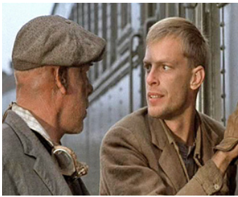
1973 L'EMPEREUR DU NORD (Emperor of the North) de Robert Aldrich avec Lee Marvin