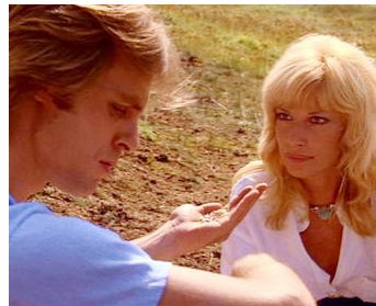
1979 UN SCANDALE PRESQUE PARFAIT (An almost Perfect Affair) de M. Ritchie avec Monica Vitti