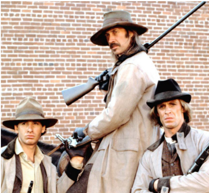
1980 LE GANG DES FRÈRES JAMES (The Long Riders) de Walter Hill avec Robert et David Carradine