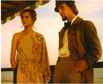
1976 BIENVENUE À LOS ANGELES (Welcome to L.A.) d'Alan Rudolph avec Lauren Hutton