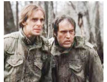
1981 SANS RETOUR (Southern Comfort) de Walter Hill avec Powers Boothe