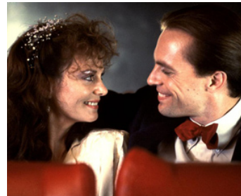
1984 CHOOSE ME (Choose me) d'Alan Rudolph avec Lesley Ann Warren