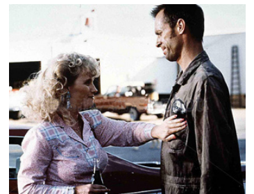
1990 DADDY'S DYIN' (Daddy's dyin'... who's got the Will?) de Jack Fisk avec Tess Harper