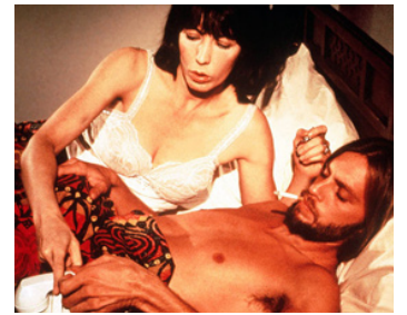
1975 NASHVILLE (Nashville) de Robert Altman avec Lily Tomlin