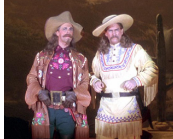
1995 WILD BILL (Wild Bill) de Walter Hill avec Jeff Bridges