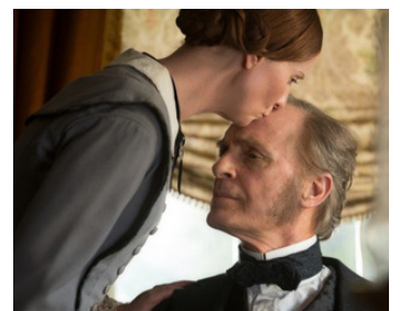
2016 A QUIET PASSION (A Quiet Passion) de Terence Davies avec Cynthia Nixon