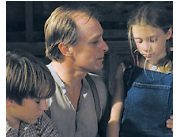
2003 THE ADVENTURES OF OCIEE NASH de Kristen McGary avec Bill Butler, Skyler Day