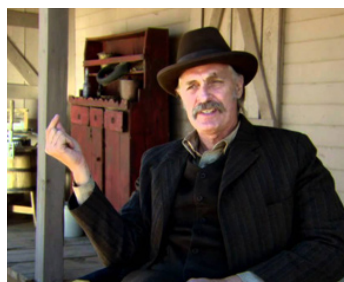
2011 COWBOYS ET ENVAHISSEURS (Cowboys and Aliens) de Jon Favreau