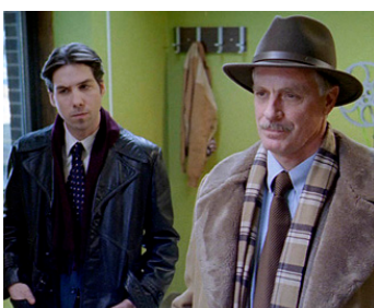
2009 WINTER OF FROZEN DREAMS d'Eric Mandelbaum avec Leo Fitzpatrick