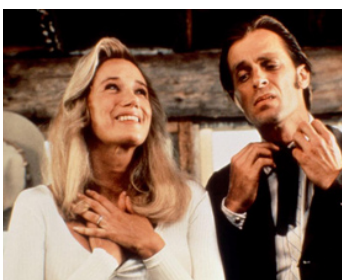
1989 COLD FEET (Cold Feet) de Robert Dornhelm avec Sally Kirkland