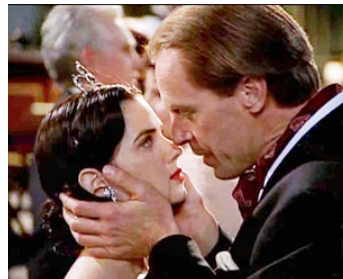
1999 OUT OF THE COLD d'Aleksandr Buravsky avec Mercedes Ruehl