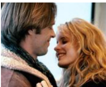
1985 WANDA'S CAFÉ (Trouble in Mind) d'Alan Rudolph avec Lori Singer