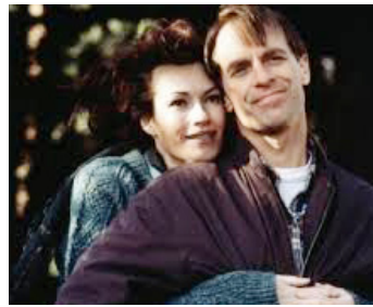
1994 ANDRÉ, MON MEILLEUR COPAIN (Andre) de T. George Miller avec Chelsea Field