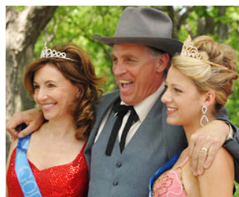
2007 ELVIS AND ANNABELLE de Will Geiger avec Mary Steenburgen, Blake Lively