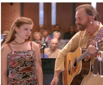
2005 LES CALIFORNIENS (The Californians) de Jonathan Parkern avec Kate Mara