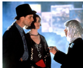
1988 LES MODERNES (The Moderns) d'Alan Rudolph avec Linda Fiorentino, G. Bujold