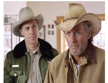
2001 WOOLY BOYS de Lezek Burzynski avec Peter Fonda