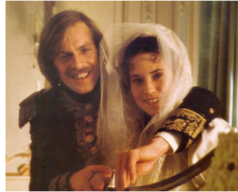
1977 LES DUELLISTES (The Duellists) de Ridley Scott avec Cristina Raines