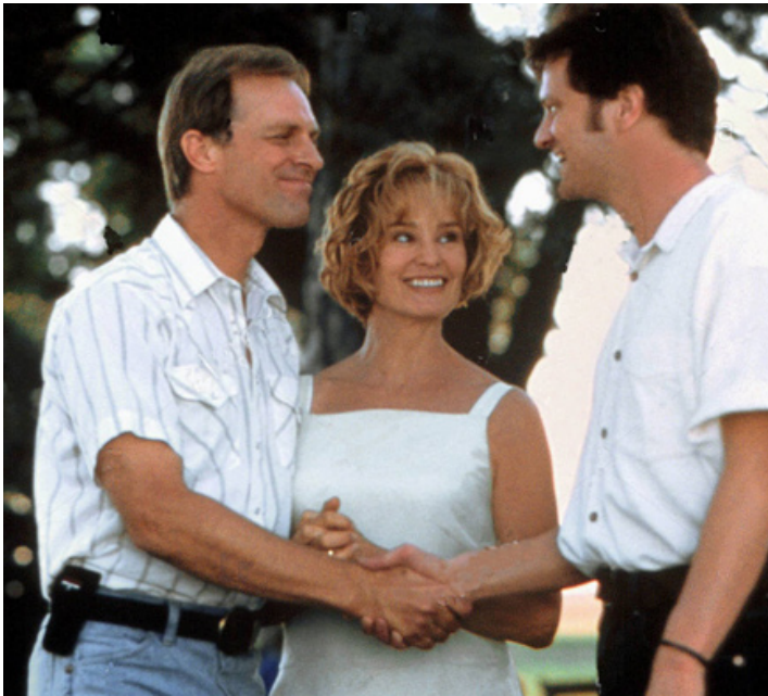
1997 SECRETS (A Thousand Acres) de Jocelyne Moorhouse avec Jessica Lange, Colin Firth