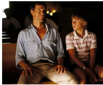
1992 CRISS CROSS (Criss Cross) de Chris Menges avec David Arnett